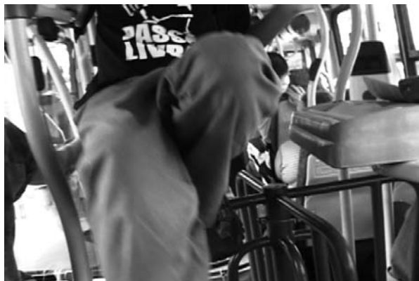
POR UMA VIDA SEM CATRACAS