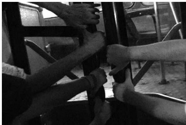
ABERTURA DA PORTA TRASEIRA DE UM ÔNIBUS